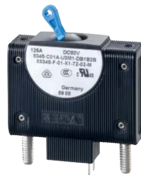
Hydraulisch-magnetischer Schutzschalter Typ 8345 + X8345-F (Fernauslösespule)