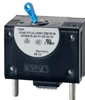
Hydraulisch-magnetischer Schutzschalter Typ 8345 + X8345-R (Fein- und Fernauslösemodul)